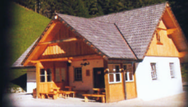
Das Anfahrts Haus

1711 war an die Seite des Kupferbergbaues auch ein Eisensteinbergbau getreten, der mit Unterbrechungen bis 1979 betrieben wurde.